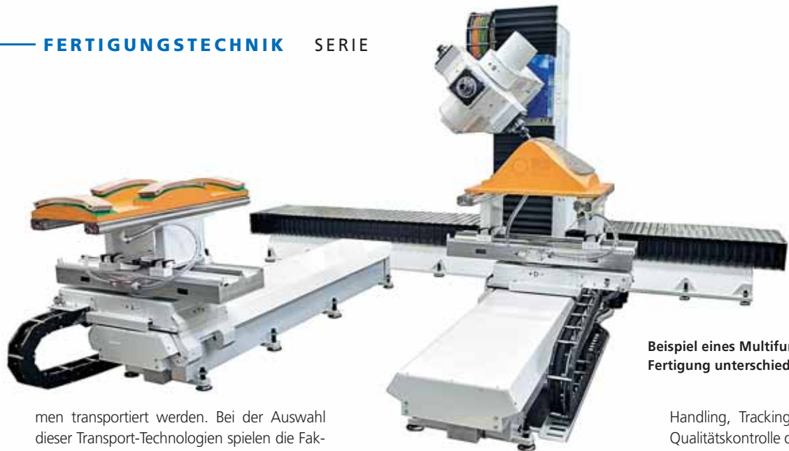
Beispiel eines Multifunktions-tisches zur Fertigung unterschiedlicher Bauteilformen

men transportiert werden. Bei der Auswahl dieser Transport-Technologien spielen die Faktoren der Häufigkeit, Transportentfernung, sowie die Anzahl der Quellen und das Senken der Transporte eine Rolle. Zudem wird eine FTF Flotte erst ab einer gewissen Flottengröße und mit Schichtmodell rentabel, da die Erstinvestitionen für Software und Infrastruktur sonst bezogen auf die Flottenstärke sehr hoch ausfallen. Bei kleineren, weniger flexiblen Transportnetzwerken schneiden dann automatisierte Rollenbahnen besser ab. Generell muss aber abgewogen werden, welche Philosophie im Unternehmen favorisiert ist, um diese gezielt verfolgen zu können. Es kann auch eine Kombination aus beiden Systemen sinnvoll sein, wobei hier eine genaue Prüfung und Abwägung der Vor- und Nachteile vorgenommen werden muss.