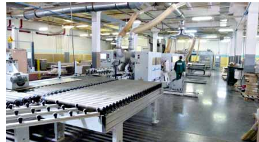
In Russland teilen sich die großen Hersteller den Markt zunehmend mit kleinen Möbelproduzenten. Deren Marktanteil wächst seit Jahren, bereits ein Fünftel aller in Russland gefertigten Sitzmöbel, Schränke und Tische stammt von einem Mittelständler

So stehen die Zeichen zwar auf weiteres Wachstum. Doch zwei Trends stellen die russischen Hersteller dabei vor große Herausforderungen. Zum einen wünschen sich die Kunden eine größere Auswahl und wollen zunehmend auch individuelle Wohnräume verwirklichen können. Zum anderen steigen die Löhne der Fabrikarbeiter kontinuierlich an. Weil die Arbeiter zudem kaum eine Bindung an ihren Arbeitgeber empfinden, kämpfen die Unternehmen mit einer hohen Fluktuation. Um auf diese Entwicklungen reagieren zu können, investieren vor allem